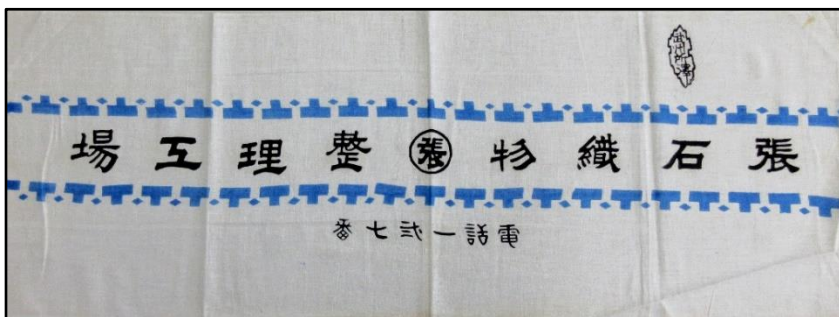
張石織物整理工場