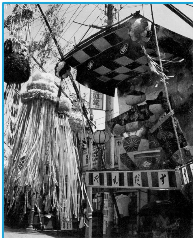
昭和30年代 銀座通り商店街 「おもちゃのすだれや」店舗前