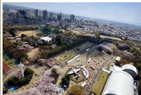
2014市民文化フェア