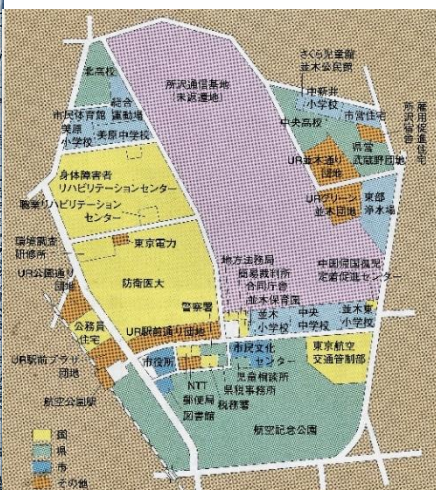
基地返還後の跡地利用図