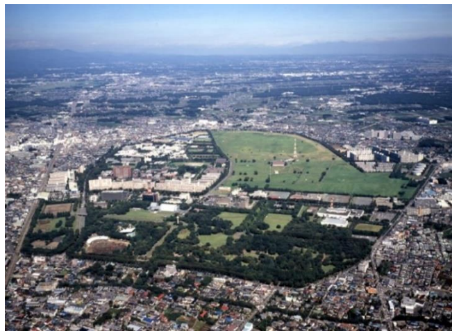
平成17年航空公園上空