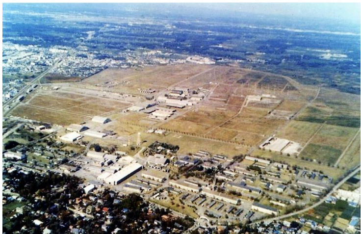
昭和45年頃基地上空返還前

戦後米軍に撤収され所沢米軍基地となり、返還後、跡地が利用され、市民の憩いの場として所沢航空記念公園が開設されました。開設までの歴史、変遷を振り返ります。