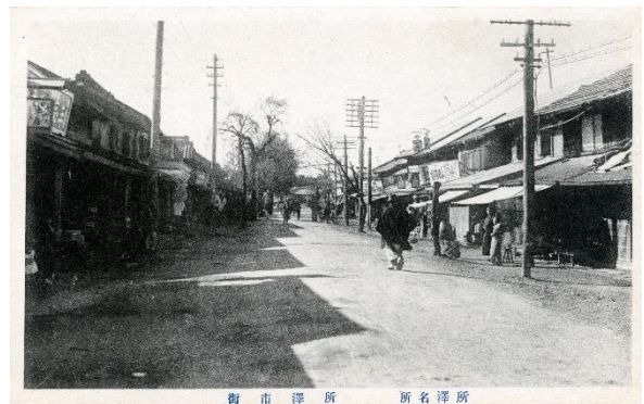
大正時代の寿町商店街界限