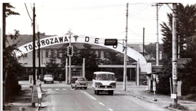
戦後：米軍基地時代のゲート前

今企画展については、今後の新型コロナウイルスの感染拡大により中止・延期などになる可能性がございます。 最新の情報は、野老澤町造商店にご確認くださいませようお願いいたします。