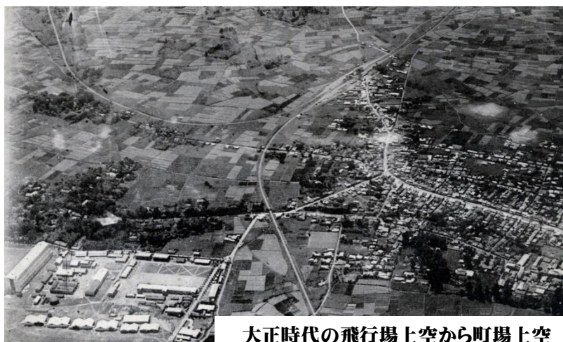
大正時代の飛行場上空から町場上空