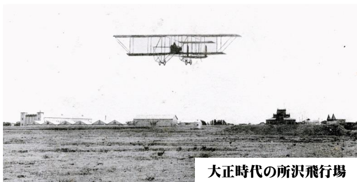
大正時代の所沢飛行場