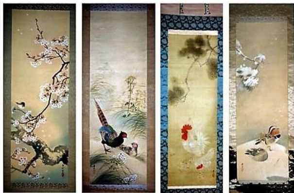
桜の小鳥 秋の雉子 松下鶏 雪中鶏