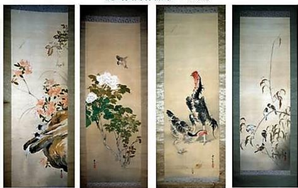
つつじに鶯 牡丹に雀 鶏 枯れ木に雀