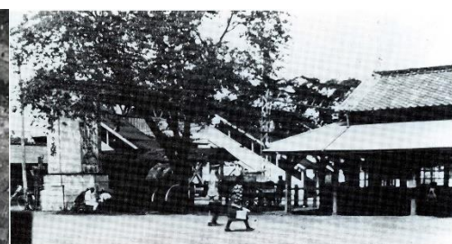
大正時代の所沢駅

所沢に関連する写真や資料 新聞切り抜き・広告などを 広く募集しております ご自宅のアルバムにある 写真、処分しようとしている 中に資料などございましたら、 一度町造までお気軽 にお問い合わせください