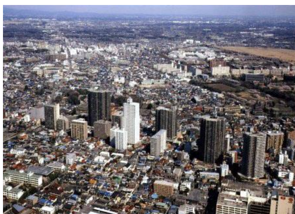
平成18年5月4日 高層マンション群