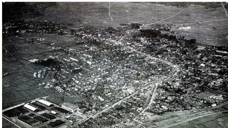
昭和12年(1937) 所沢駅上空から旧所沢中央市街地を望む