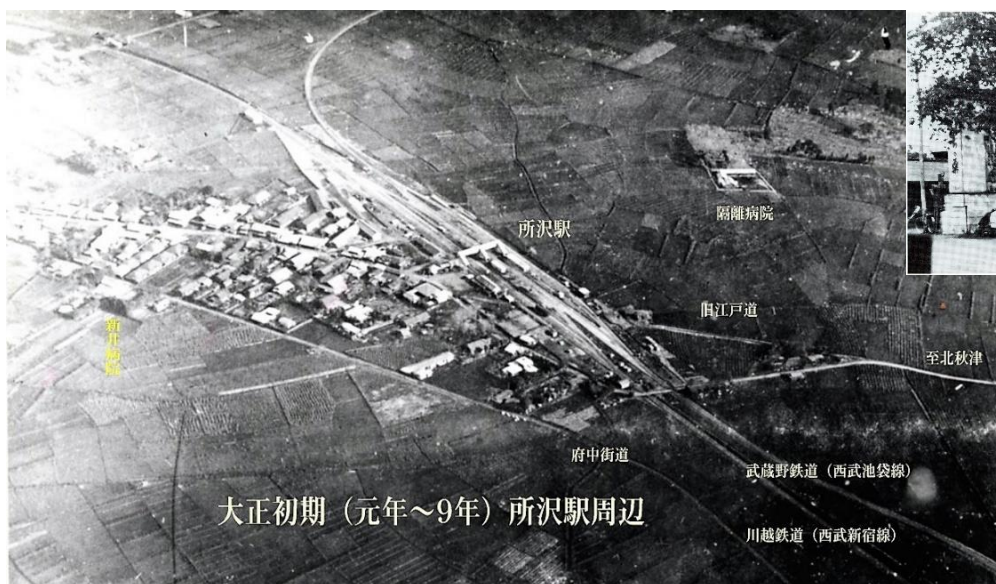
大正初期(元年~9年) 所沢駅周辺