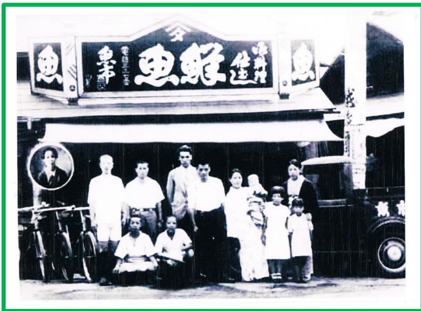
上：日吉町にあった「魚市」 現在の「グリーン」 右：ねぎしの交差点 昭和 60 年頃

所沢生まれ・所沢育ちの皆様に まちぞう にお集まりいただき、にぎやかに楽しくおしゃべりいたしましょう! 平成生まれの方・昭和生まれの方・ずっと昔に生まれた方? 何年生まれの方でもOKです。そうそう、所沢にお嫁に来て早〇〇年、今や充分に「所沢育ち」になった方だっていいんです。みんなでわいわい「その時代 その時代ごとの思い出話」をしてみませんか? 新しく所沢に越してきた方も、これから「所沢人」になるのですから、是非 どうぞお気軽にご参加ください。 所沢の町の歴史がみなさんのおしゃべりの中から垣間見えるはずです。