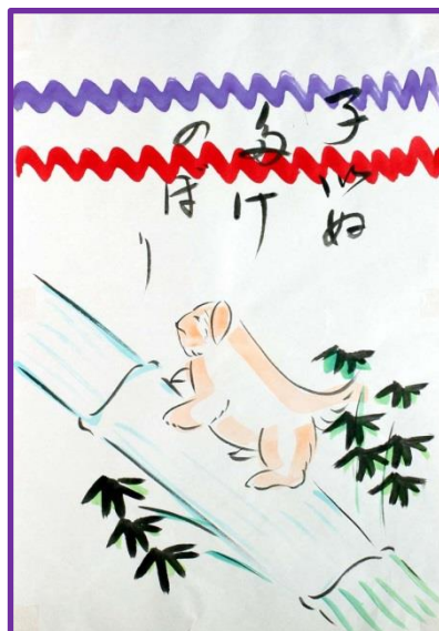
こいぬ たけのぼり 元句：鯉の滝登り