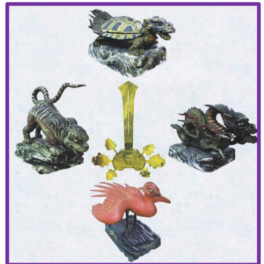
所沢市指定有形民俗文化財 四神剣 7/15(土)16(日)有楽町 八雲神社に展示