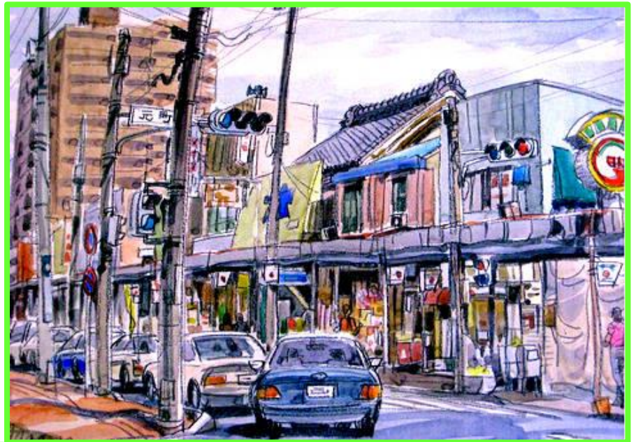
所沢市元町交差点付近 画：堀田 富彌 氏 ←2016年10月 ↑1993年

これからも変化し続けるであろう 「所沢の町」の様子をちょっとだけ 振り返って 自分たちが知っている 「昔」と10年・20年先の子ども 達の「未来」を想像してみませんか？