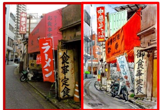
→ 御幸町 50年続く 横丁の ラーメン店