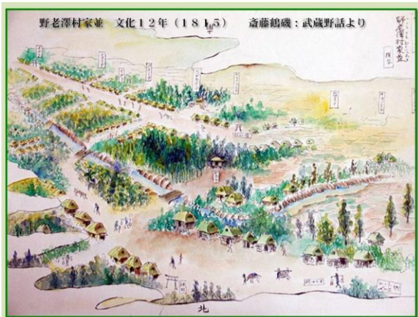
江戸時代の町並み