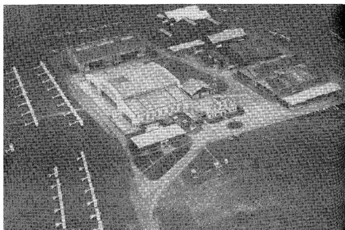
飛行場中央格納庫・気象観測所

織物の町だった所沢に明治44年(1911)4月1日日本最初の飛行場が開設され日本航空の教育がはじまりました。全国から多くの優秀な航空関係者やパイロットが住む飛行場の町から戦後の基地の町へと変遷した町場の歴史を貴重な写真、資料から振り返ります。