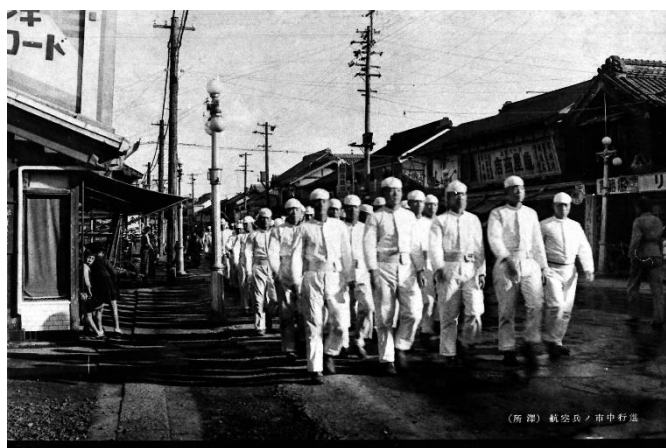
街中を行進する飛行学校生徒